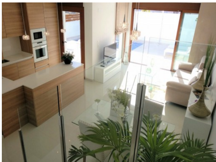
Offenes Wohnzimmer 3/4