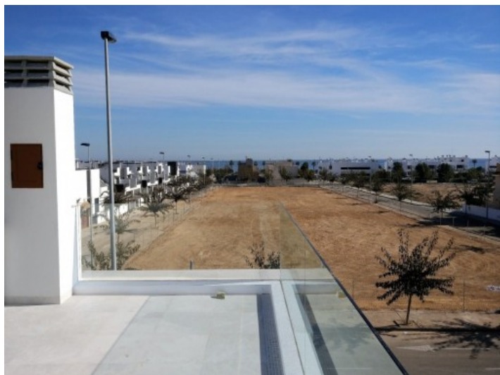
Meeresblick von der Dachterrasse