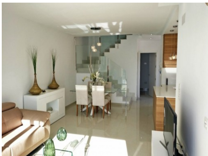
Offenes Wohnzimmer 1/4