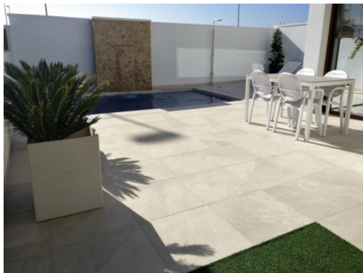
Pool mit Außendusche