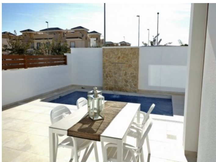
Außenbereich mit Pool

Alle Angaben nach bestem Wissen. Irrtum und Zwischenverkauf vorbehalten. Dieses Exposé ist eine Vorinformation, als Rechtsgrundlage gilt allein der notariell abgeschlossene Kaufvertrag.