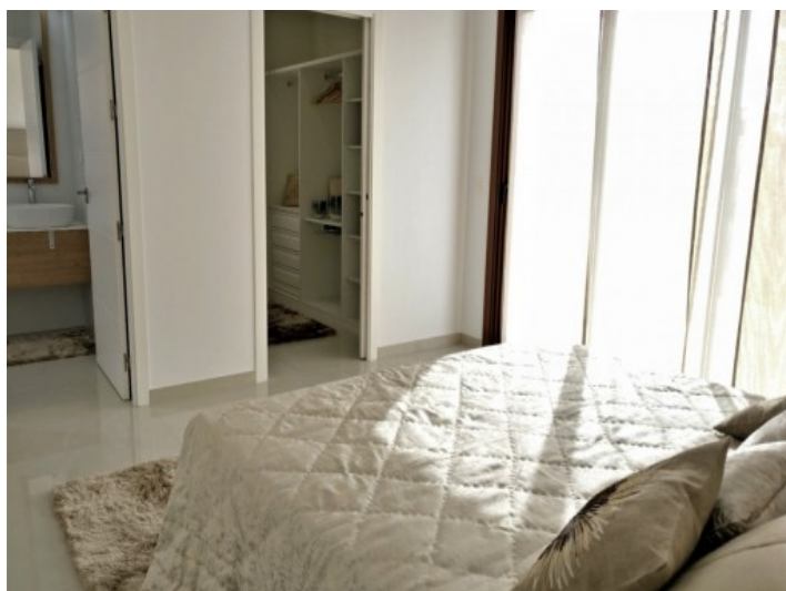
Lichtdurchflutetes Schlafzimmer mit Ensuit Badezimmer