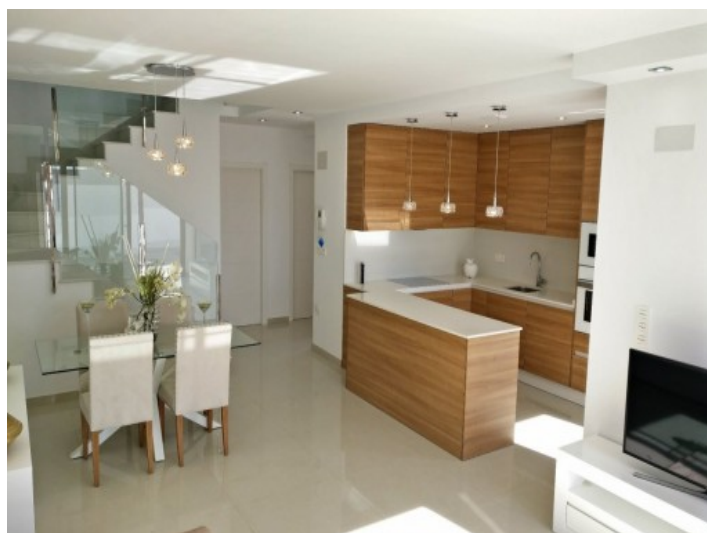
Offenes Wohnzimmer 2/4