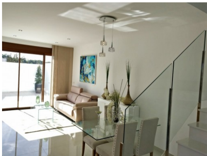
Offenes Wohnzimmer 4/4

Alle Angaben nach bestem Wissen. Irrtum und Zwischenverkauf vorbehalten. Dieses Exposé ist eine Vorinformation, als Rechtsgrundlage gilt allein der notariell abgeschlossene Kaufvertrag.