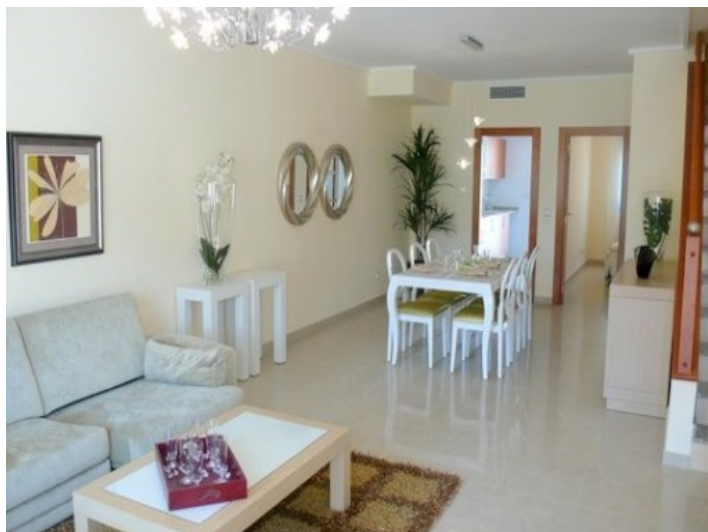
Stylisch eingerichteter Wohnraum