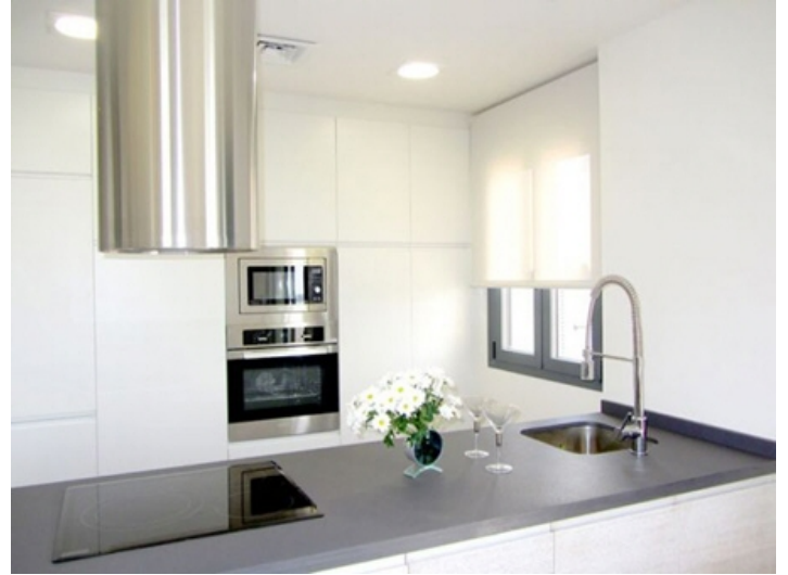
Helle und freundliche Küche