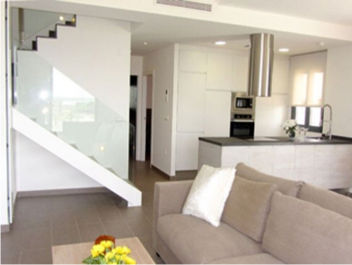
Neubau-Villa mit moderner Einrichtung