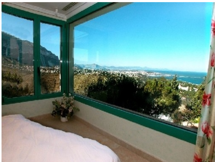
Eines der großartigen Schlafzimmer mit traumhaften Ausblick auf das Meer und die Berge