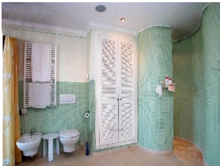
Eines der eleganten Badezimmer