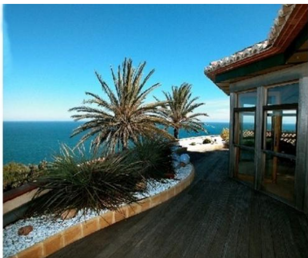
Der paradisiische Ausblick der Villa