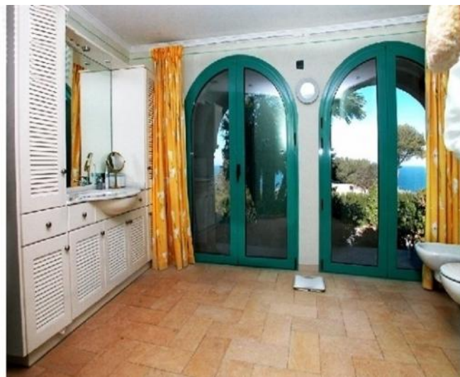
Eines der eleganten Badezimmer