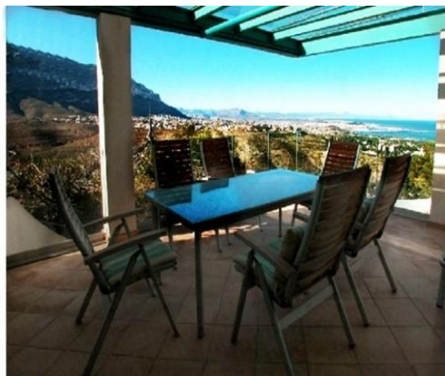
Die überdachte Terrasse mit märchenhaftem Ausblick

Alle Angaben nach bestem Wissen. Irrtum und Zwischenverkauf vorbehalten. Dieses Exposé ist eine Vorinformation, als Rechtsgrundlage gilt allein der notariell abgeschlossene Kaufvertrag.