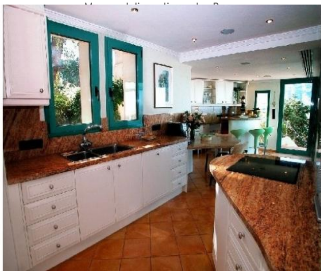
Die große Einbauküche mit Bar und direktem Zugang zum überdachten Balkon