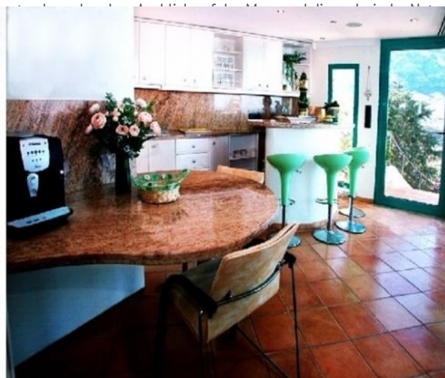
Die große Küche mit Bar und direktem Zugang zum überdachten Balkon