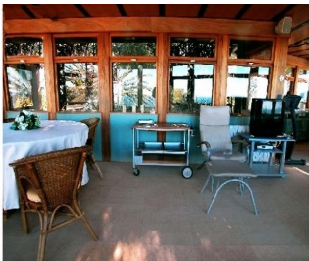
Die gemütliche Terrasse mit Grillplatz