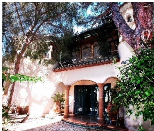
Der Eingang der luxuriösen Villa