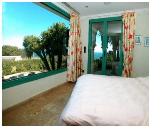
Eines der stilvollen Schlafzimmer mit riesiger Fensterfront und Blick auf das Meer