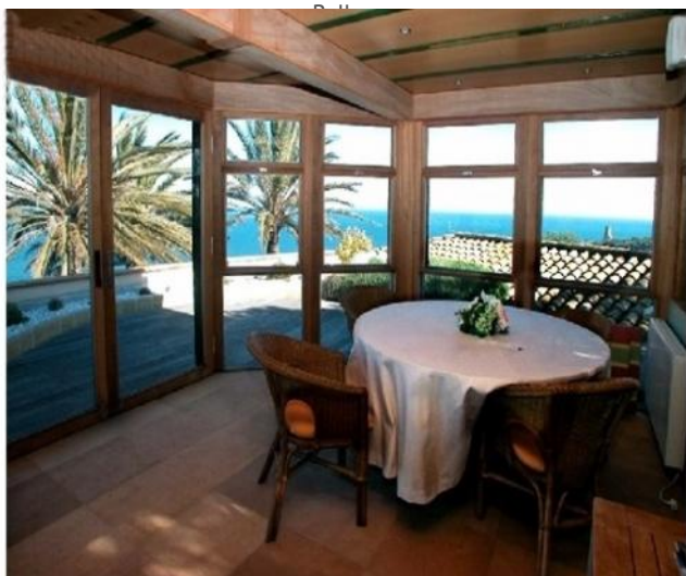
Der gemütliche Essbereich mit Rundblick auf das Meer